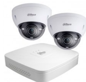
Kahden ulkokameran paketti kupukameroilla