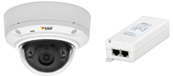
Yhden ulkokameran paketti sisältäen kameralle ja PoE-injektorin

Paketti sisältää yhden ulkokameran asennettuna ja käyttöönotokunnossa. Kameran kaapeli tuodaan asuntoon sisään ja liitetään PoE-injektoriin. Injektori kytketään pistorasiaan ja siitä jatketaan tiedonsiirtokaapeli laajakaistalaitteelle. Tällä tavoin saadaan kameralle sähkövirtaa ja samalla tieto kulkemaan kameralle ja laajakaistalaitteen välillä. Kuvan tallentaminen tapahtuu kamerasa olevalla 64Gb muistikortille.