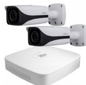
Kahden ulkokameran paketti bullet-kameroilla